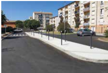
Place Alexandre Girard. Réorganisation complète de cette place pour améliorer la sécurité ainsi que les conditions de stationnement.