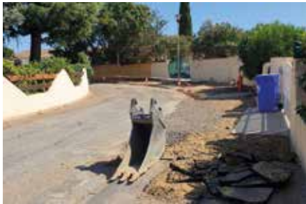
Impasse des Arbousiers. C'est aussi dans les zones pavillonnaires que la chaussée a besoin d'un lifting ! Ici, toute l'emprise publique est en cours de réfection, trottoirs y compris.