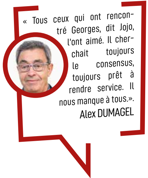
Toute la famille était présente pour commémorer le souvenir d'un passionné de la pétanque.