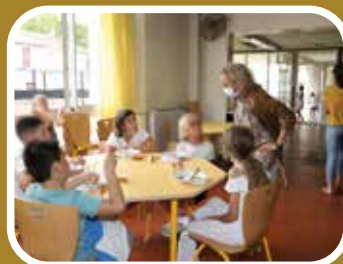
Une rentrée goûteuse à la cantine scolaire