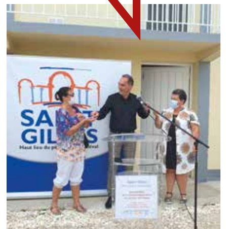
L'association nautique et le club de plongée ont reçu les clés des mains du maire.