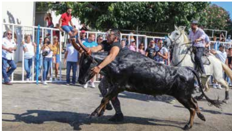
La gaze et les abrivados en centre-ville ont retrouvé le public, venu en nombre pour profiter du grand retour de nos traditions taurines.

D ans nos arènes, dans nos rues et dans nos cœurs : les taureaux ont fait leur grand retour à Saint-Gilles ! Grâce à l'engagement de vos élus et au travail de vos agents municipaux, Feria et fête se sont bien déroulées, même sous pass sanitaire. Les participants se sont pliés aux exigences des autorités pour lutter contre le Covid, notamment grâce à la distribution de bracelets par l'Association des festivités de Saint-Gilles pour éviter de présenter son pass à chaque rendez-vous. Merci à tous ceux qui ont amené leur joie de vivre, aux empresas des arènes qui nous ont offerts de beaux moments taurins, aux manadiers qui ont assuré (notamment) une gaze d'anthologie et RDV très bientôt pour la Fête de la Toussaint (28 octobre au 14 novembre 2021) !