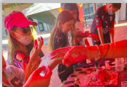
Jardin japonais, porte bonheur, lanternes, carpe coi, Photophore, éventail, tanzalcu, dragon, jardin zen : les activités manuelles, culturelles et artistiques ont été nombreuses.