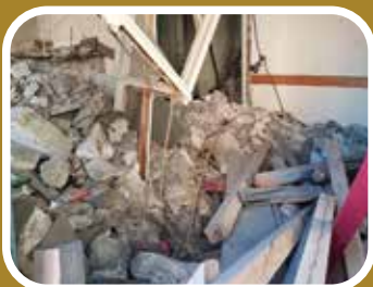
Les bâtiments abandonnés dans le viseur de la Ville