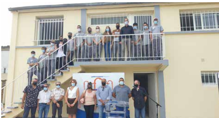
Les salariés du chantier d'insertion, le maire et ses élus, ainsi que les agents municipaux, fiers du résultat de leurs efforts de toute l'année.

de rénovation menés par le chantier d'insertion Les Saladelles : électricité, carrelage, maçonnerie, peinture, isolation, les deux étages ont été refaits du sol au plafond ! Le résultat est impeccable et fait la fierté des salariés du