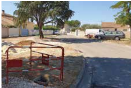
Impasse des Cyprès. Les travaux ont débuté à l'automne et devraient durer un mois, le temps de refaire l'enrobé, mais aussi toutes les bordures.