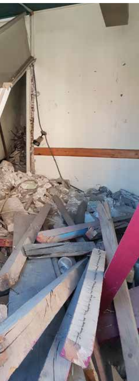
Situé en plein centre de Saint-Gilles, sur l'artère la plus fréquentée de la ville, ce bâtiment du 51 boulevard Gambetta a été abandonné depuis des années par son propriétaire privé. La Ville est intervenue.