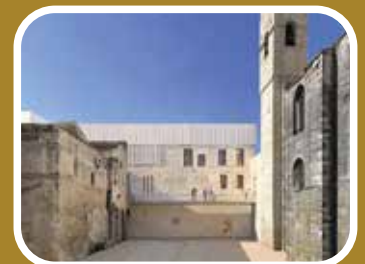
W-architectures remporte le concours