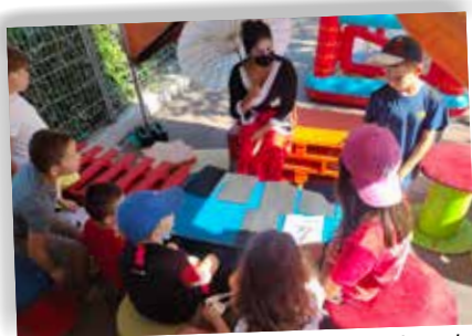
Au centre de loisirs, l'été s'est déroulé sur le thème du Japon, en lien avec les JO de Tokyo. Les animateurs n'ont pas hésité à se prêter au jeu en enfilant des déguisements.

C'est la somme investie cette année dans le mobilier neuf pour les écoliers et équipes pédagogiques.