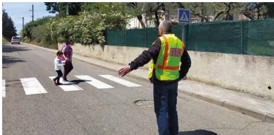
Le dispositif a été mis en place en mai 2021.

Les candidatures sont à adresser, avant le 1 er mars 2021 inclus, à : Monsieur le Maire Service des Ressources Humaines Place Jean Jaurès - 30800 Saint-Gilles