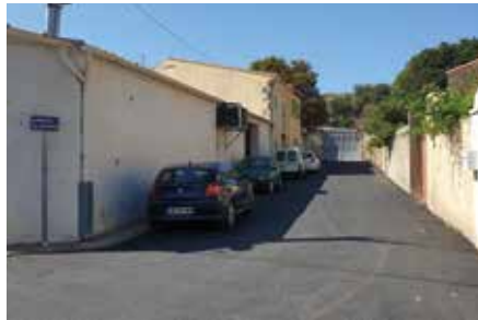
Impasse des Bergers et rue Baptiste Marcet (bas). Les services techniques ont attendu qu'un nouvel immeuble d'habitation soit terminé et les câbles enterrés, pour regoudronner la chaussée.