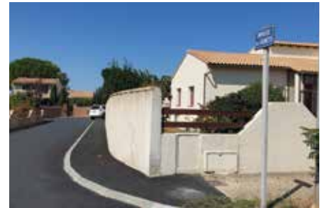
Impasse des Genêts. La rue avait besoin d'un sérieux coup de jeune, ce qui a été fait au cours de l'été 2021 sous l'égide des services techniques de la ville.